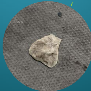
Kauwgom minimaal 20 jaar