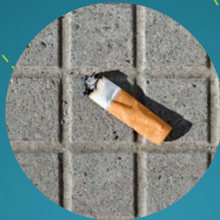
Sigarettenpeuk 12 jaar