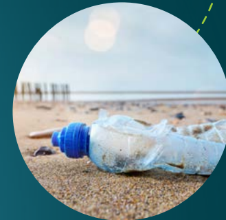
Plastic flesje niet afbreekbaar verbrijzelt wel, maar breekt niet af