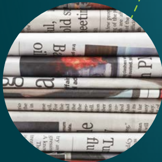
Krant 1,5 tot 6 maanden