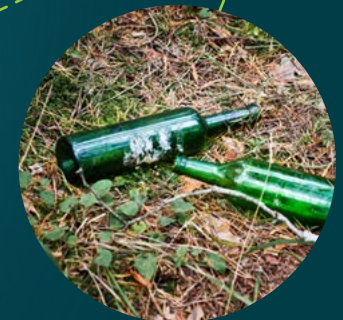
Fles van glas niet afbreekbaar blijft voor altijd in de natuur liggen