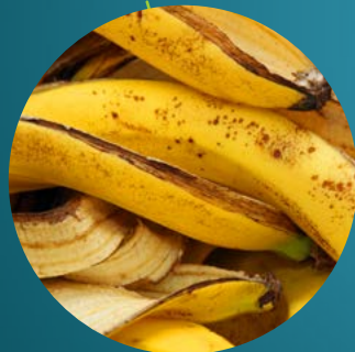
Bananenschil 1 tot 3 jaar