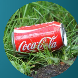
Aluminium blikje niet afbreekbaar